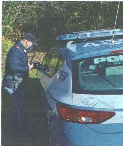
A Castellanza un giovane in monopattino inseguito e bloccato dopo un tentativo di fuga

pubblicato il 14/04/2022 a pag. 25; autore: Veronica Deriu