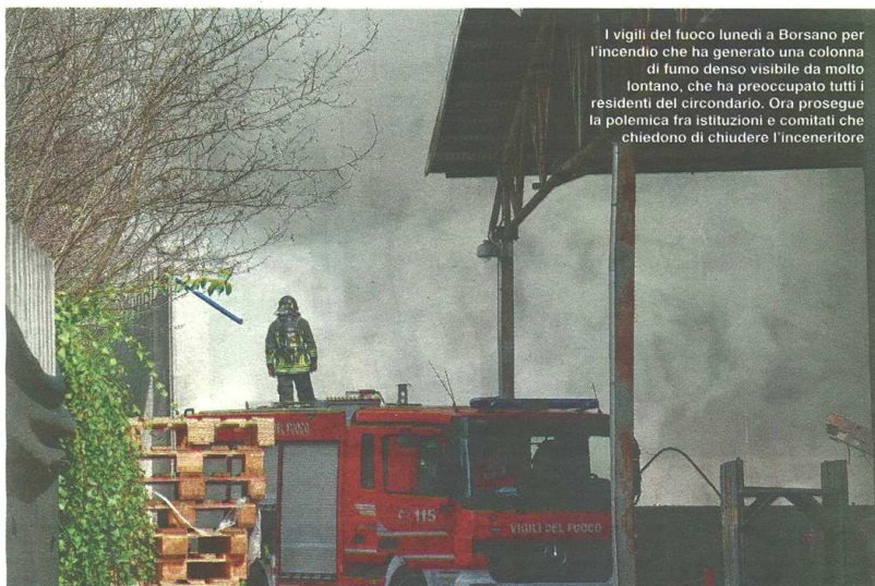
I vigili del fuoco lunedì a Borsano per l'incendio che ha generato una colonna di fumo denso visibile da molto lontano, che ha preoccupato tutti i residenti del circondario. Ora prosegue la polemica fra istituzioni e comitati che chiedono di chiudere l'inceneritore

REGIONE Cattaneo: «Non ci sono pericoli. A Neutalia gente seria»