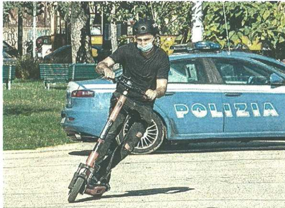
Alla vista degli agenti il giovane ha cercato di scappare ma non ce l'ha fatta

pubblicato il 14/04/2022 a pag. 3; autore: Rosella Formenti