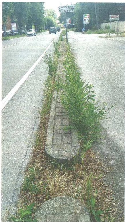
Le banchine a lato delle due arterie saranno rifatte

CASTELLANZA Parte un piano di messa in sicurezza