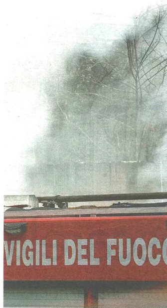
Numerosi equipaggi dei vigili del fuoco sono intervenuti a Borsano per spegnere le fiamme