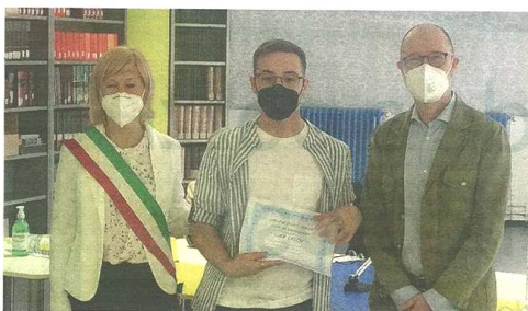
L'Istituto Facchinetti di Castellanza ha celebrato la sua giornata di ringraziamento alla presenza delle autorità