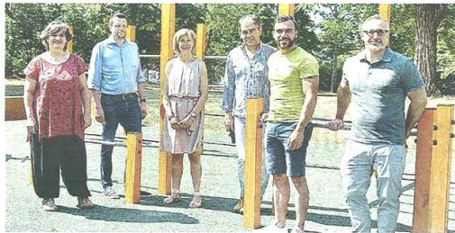
La presentazione del progetto per l'estate di Castellanza