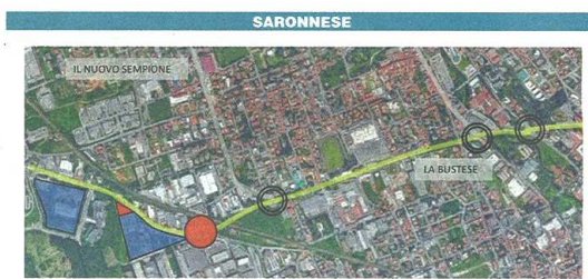
Figura 3 – previsione di una nuova rotatoria in prossimità dell'AT 3B