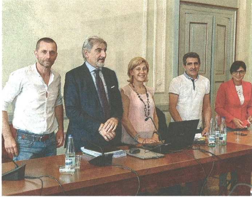
La riunione del tavolo tecnico sui cattivi odori in Valle Olona con l'assessore regionale Raffaele Cattaneo (foto G302)

VALLE OLONA - «Una richiesta inaccettabile e pretestuosa». I Circoli Legambiente BustoVerde e Valle Olona criticano con fermezza la richiesta dell'azienda Perstorp di Castellanza di altri sei mesi per adeguare i suoi impianti all'abbattimento delle aldeidi fino a 2 milligrammi per litro: «Dopo anni di attesa e quindi di preavviso, non è credibile che una multinazionale, leader mondiale nella produzione e innovazione nel settore chimico, non abbia programmato l'adeguamento», affermano i gruppi ecologisti, citando quanto compare sul sito dell'azienda: «Utilizzando i più piccoli elementi costitutivi della natura, possiamo andare a far progredire la vita di tutti i giorni, rendendola più sicura, più conveniente e rispettosa dell'ambiente. Siamo il fornitore di soluzioni sostenibili». Legambiente, tuttavia, si domanda di quale sostenibilità si parli: «Non certo quella dei cittadini che abitano nelle vicinanze dell'impianto, né della salute dell'ambiente in generale». Il sodalizio cita quindi gli anni di monitoraggio e proteste per le molestie olfattive insopportabili... «È quando arriva finalmente la sentenza del Consiglio di Stato, leg-