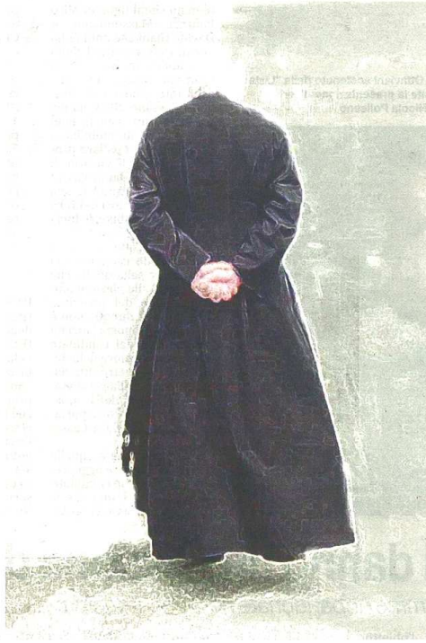
Vittima un'officina che aveva deciso di accogliere l'invito a prestare materiale per regalare un Natale più felice ai parrocchiani

Lo hanno imparato a proprie spese i titolari di una storica autofficina di Castellanza, turlupinati da un rom ventinovenne, pregiudicato, che ha residenza a Seveso e che porta il cognome di una rinomata famiglia nomade. Il pubblico ministero Nadia Calcaterra ha chiuso le indagini sul ragazzo che ora avrà venti giorni per decidere se essere interrogato o aspettare la pressoché scontata richiesta di rinvio a giudizio. L'episodio contestato risale proprio a sei mesi fa. Il rom, dopo aver raccolto le informazioni necessarie, chiamò in officina annunciandosi come responsabile della parrocchia sotto cui ricade l'attività. «Avremmo bisogno di batterie per illuminare il presepe» spiegò al proprietario precisando che, trascorse le feste, la comunità avrebbe restituito ogni pezzo e proponendo di pagare il noleggio. «Mando il mio coadiutore a prenderle», aggiunse. E così, a distanza di meno di ventiquattro ore, l'assistente del sacerdote - ossia il ventinovenne stesso - si presentò nell'autorimessa con un mezzo adeguato e caricò ben otto batterie e un manutentore di carica. Con il senno di poi, con tutti que-