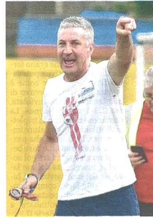
Anche Mazzoleni annuncia l'addio

pubblicato il 30/05/2022 a pag. 35; autore: Matteo Floccari