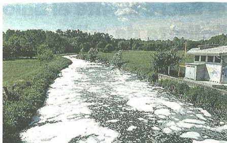
La schiuma ricopre il corso d'acqua. Nell'Olon vengono rilasciati aldeidi

«Su come ridurre le emissioni, proseguirà il confronto tecnico con Regione e istituzioni locali per arrivare al risultato da tutti auspicato, ovvero l'azzeramento delle molestie olfattive» ha detto Cattaneo. Intanto nel fiume e nell'aria si scaricano anco-