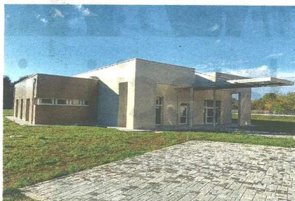
La firma dell'accordo e la sede della struttura sociale