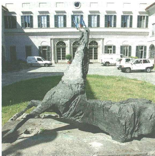
A Castellanza 148 cittadini percepiscono il reddito di cittadinanza