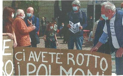
Una delle tante manifestazioni che nel corso degli anni sono state organizzate per chiedere la chiusura del termovalorizzatore (Archivio)

pubblicato il 06/10/2022 a pag. 22; autore: Francesco Inguscio