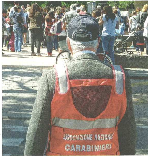
I nonni vigili svolgono un servizio essenziale, non sempre apprezzato

Basti pensare a che cosa succede davanti alle scuole Maria Ausiliatrice in via Cardinal Ferrari e alle elementari De Amicis in viale Lombardia e strade limitrofe: addirittura c'è chi, trovandosi la strada sbarrata, non si fa scrupolo di uscire dalla macchina e spostare le transenne; col risultato che poi, se non vengono rimesse a posto, ne passano anche altri. Un comportamento che il primo cittadino ha spesso definito «inqualificabile e irrispettoso di chi è costretto a fare gli slalom fra le auto per accompagnare i figli a piedi». Per questo è stato istituito il divieto di transito quando entrano o escono gli allievi: per tutelare la loro sicurezza. Del resto si tratta di un'esigenza manifestata da molti cittadini, cui bisognava per forza dare seguito. Il vero problema è che, quando i genitori vanno a prendere o accompagnano i figli a scuola con l'auto, hanno sempre molta fretta: se potessero parcheggierebbero anche dentro il plesso, perché per loro fare il giro lungo o posteg-