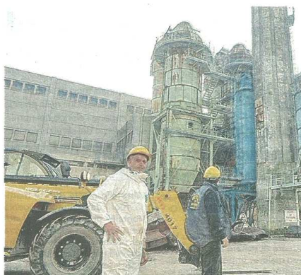
Per riqualificare l'impianto di Borsano sono previsti 90 milioni di euro d'investimenti

Neutalia integrerà la produzione energetica del termovalorizzatore agli impianti di teleriscaldamento della zona, ricavando energia dai rifiuti: tutto questo con investimenti sull'impianto pari a circa 90 milioni di euro (poco meno di trenta milioni tra quelli effettuati quest'anno e quelli che verranno spesi entro la fine del prossimo anno), in gran parte concentrati in questi primi anni, ai quali sommare quelli per il collegamento tra impianto di Borsano e teleriscaldamento di Legnano e Busto Arsizio. Un intervento che si farà, quest'ultimo, con o senza i sei milioni di euro che potrebbero arrivare con la partecipazione al bando per i fondi del Pnrr e che, nel caso arrivassero a destinazione i fondi (sei milioni dei 16 necessari), avrebbe la «fine lavori» fissata al 2026. «Avevamo