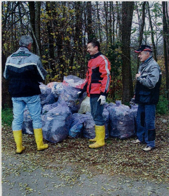
Anche il Comune di Castellanza ha aderito a "Puliamo il mondo"

pubblicato il 29/09/2022 a pag. 23; autore: Stefano Di Maria