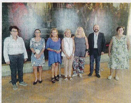
La presentazione del progetto «Un nido per noi»

CASTELLANZA (gmt) Si intitola «Un nido per noi» ed è il progetto di formazione - cui il Comune di Castellanza ha aderito - progettato per facilitare l'individuazione precoce dei segnali di disagio e/o maltrattamento fisico o psichico nei minori che frequentano i nidi. Il percorso è stato attivato da Ats Insubria e verrà erogato da Cooperativa Sociale Davide che ne ha curato la progettazione scientifica e didattica. Oltre agli operatori dei nidi del Comune di Castellanza parteciperanno alla formazione anche operatori del Comune di Busto Arsizio, che ha già beneficiato di interventi analoghi.