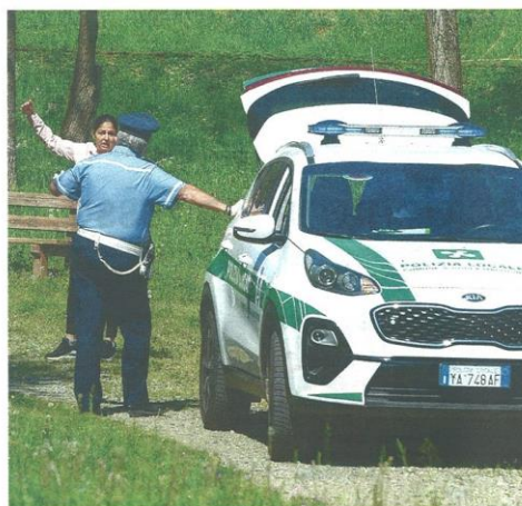
Anche gli agenti delle polizie locali del territorio saranno coinvolti nelle indagini coordinate dalla Procura sui reati ambientali