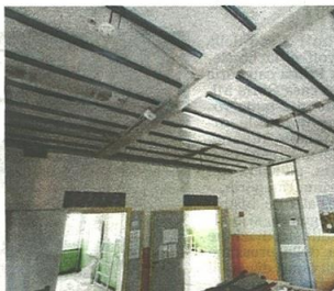
Alcuni dei lavori alla scuola primaria De Amicis di Castellanza