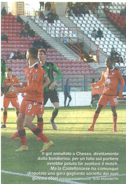
Il gol annullato a Chessa, direttamente dalla bandierina, per un fallo sul portiere avrebbe potuto far svoltare il match. Ma la Castellanzese ha comunque disputato una gara gagliarda sorretta dai suoi giovani tifosi