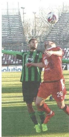
Chessa duella in una fase del match fra Piacenza e Castellanzese, vinto di misura dai padroni di casa