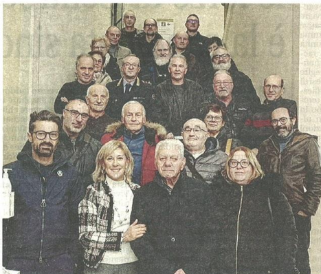
La serata di presentazione del nuovo gruppo di Controllo di Vicinato nato a Castellanza

«L'Amministrazione aderisce dal 2015 - dichiara il sindaco - Il programma di mandato, volto a soste-