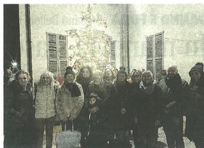
L'accensione dell'albero di Natale davanti al Municipio

ensione, Pro Loco e Alpini hanno offerto a tutti i presenti cioccolata e vin brulé nel cortile del Municipio, accanto ai banchetti per la distribuzione dei panettoni allestiti dai genitori. L'albero di Natale resterà per tutto il periodo natalizio a illuminare le feste e la città, ricordando la necessità di regalare a tutti una vita di serenità e di pace. L'abete, concluso le festività verrà riportato e accudito nel suo luogo d'origine, in Piemonte, in attesa di del prossimo Natale.