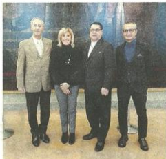
La presentazione del concorso

CASTELLANZA (pi) Torna il concorso di danza Tony Rose a sostegno di Telethon, in collaborazione con Regione Lombardia e CIDS - Coordinamento Italiano Danza Sportiva. Anche quest'anno da oggi, venerdì, fino a domenica la danza sportiva e la musica animeranno il Palaborisani di via Legnano. Le competizioni sono multidisciplinari, da quelle accademiche a solo, in coppia o in gruppi per moderni, jazz e contemporary, a quelle coreografiche dei balli latini, alle danze country western, caraibiche, street e pop dance passando per boogie woogie e rock acrobatico. Il Concorso Tony Rose - Trofeo Telethon è un evento di Danza e Ballo nelle categorie B e C per i ballerini amatori e agonisti di tutte le età, dagli under 15 agli over 70, che ha come obiettivo la diffusione a 360 gradi di uno sport completo e divertente come la danza, ma con una attenzione particolare alla solidarietà. Giunto al suo 28° compleanno, il concorso devolverà infatti come nella sua tradizione, gli incassi della manifestazione a Telethon, contribuendo così ai progetti di ricerca