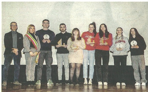
Gli atleti che sono stati premiati