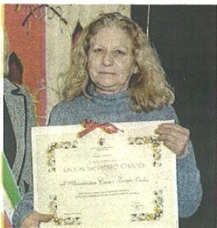
La consegna delle benemerienze civiche

L'iniziativa vuole essere un riconoscimento simbolico a cittadini e sodalizi che abbiano accresciuto il prestigio della città