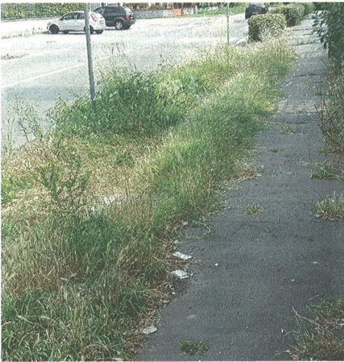
In alto l'erba alta all'area cani e sotto i marciapiedi di via don Gnocchi