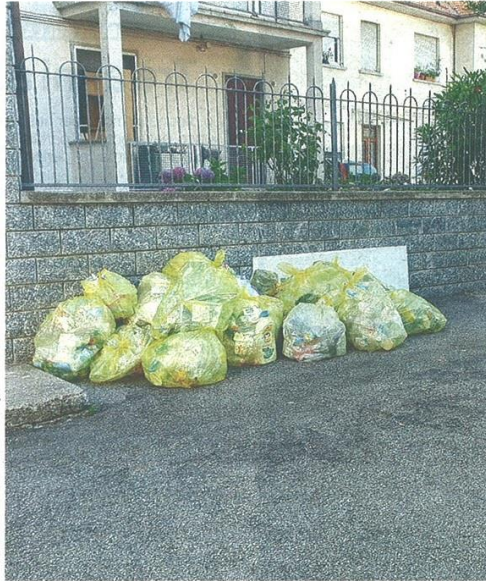
Sacchi di rifiuti "dimenticati" sulle strade di Castellanza per giorni e a volte settimane (qui via Alla Brera): proteste nei confronti di Sieco