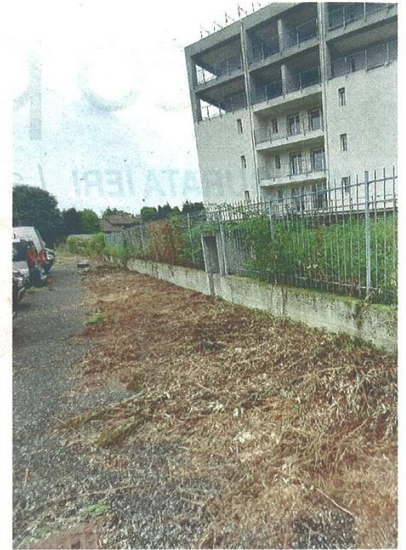
Rifiuti abbandonati, marciapiedi malconci e vegetazione incolta accanto alle case: i residenti del rione tra via Petrarca e via Buonarroti sono stanchi dei disagi con cui convivono ormai da anni