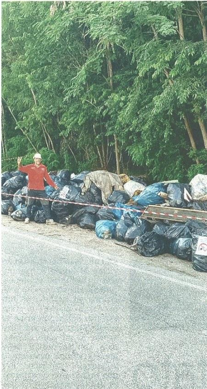
L'impressionante distesa di rifiuti raccolti nel bosco

CASTELLANZA Raccolti 200 sacchi, costi di smaltimento enormi