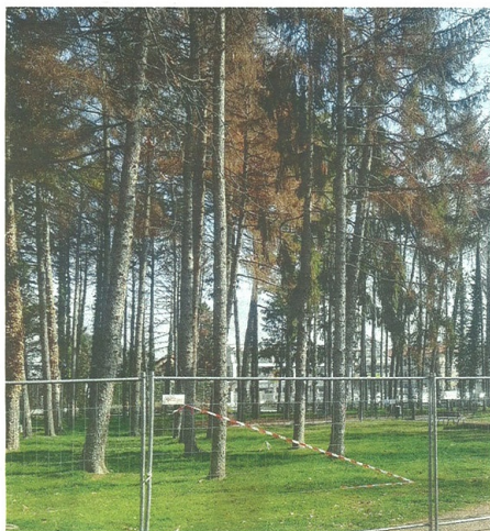
Due immagini degli alberi che dovranno essere abbattuti: in alto gli alberi al parco dei Platani, ormai morti. Sotto, le robinie che minacciano la rete elettrica in via per Rescalda (Blitz)