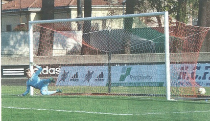
Un rigore realizzato da Cocuzza ha dato il via alla rimonta della Castellanzese nel derby delicatissimo contro la Castanese

I neroverdi vincono il delicatissimo derby con la Castanese