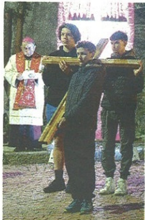
Alcuni momenti della Via Crucis di ieri sera a Castellanza con l'arcivescovo Delpini

Successo per la Via Crucis della Diocesi