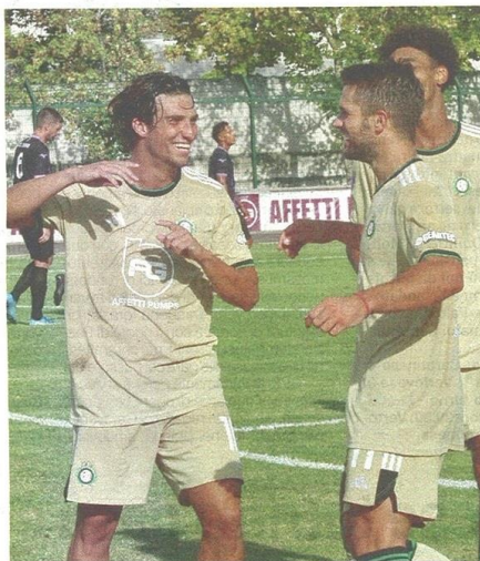
Pastore e la Castellanzese festeggiano

SPADA SALVA - La manovra della Castellanzese si fa attendista, nella speranza di chiamare gli avversari fuori dalla propria trequarti, ma l'occasione più importante capita sui piedi dello stesso Perkovic, smarcato da un buco difensivo centrale incredibile, ma fermato dalla perfetta uscita di Spada a mano aperta. Il tecnico ospite, Raffaele Scudieri, si affida a un propositivo 3-4-3, ma mette mano all'undici iniziale già nel finale di primo tempo, inserendo l'at-