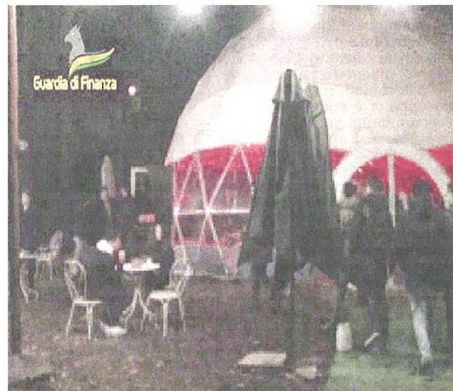
La discoteca abusiva scoperta dagli agenti della Guardia di Finanza

curezza e dei titoli abilitativi di prevenzione incendi, adempimenti necessari e indispensabili per la gestione in sicurezza di locali aperti al pubblico.