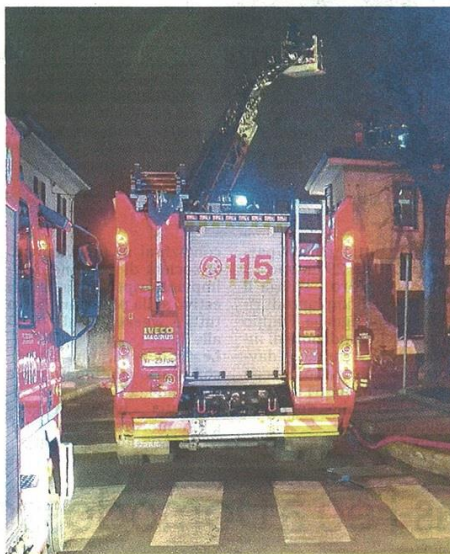
Sono intervenuti anche i vigili del fuoco nelle vicinanze della centrale elettrica, chiamati dai residenti

Emblematico quanto successo domenica: «Ci siamo svegliati alle 6 per colpa dell'attivazione degli impianti, che ha prodotto il solito rumore sordo e le vibrazioni che non ci danno pace - raccontano le famiglie del comitato - Sono andati avanti fino alla sera, quando abbiamo chiamato i