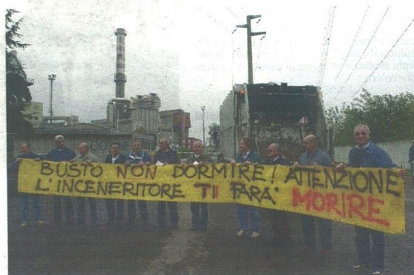
Una manifestazione contro l'inceneritore di Borsano. Da quasi un anno i comitati attendono gli esiti dell'indagine epidemiologica sui rischi dell'impianto per la salute