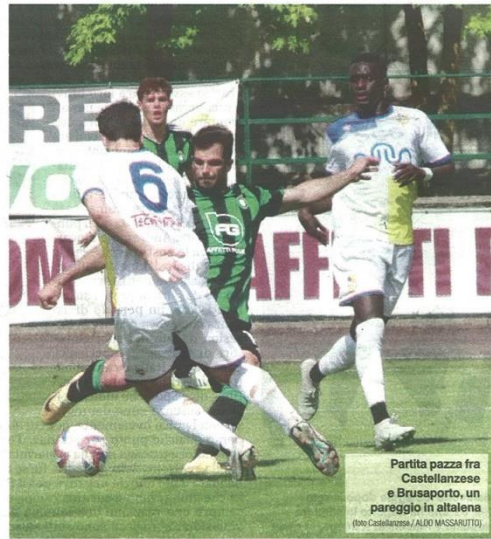
Partita pazzica fra Castellanzese e Brusaporto, un pareggio in altalena

Alessio Salerio © RIPRODUZIONE RISERVATA