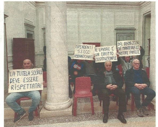
I lavoratori Sieco hanno partecipato alla seduta del Consiglio comunale

Stefano Di Maria © RIPRODUZIONE RISERVATA