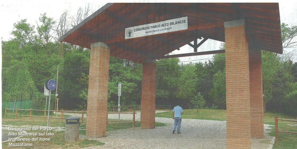
L'ingresso del Parco Alto Milanese sul lato legnanese del rione Mazzafame