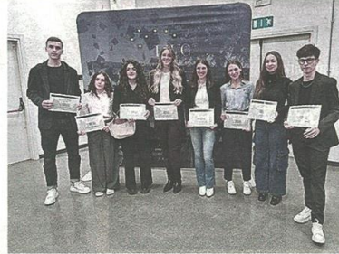
Gli studenti dell'ateneo di Castellanza premiati con borse di studio per i meriti accademici e sportivi