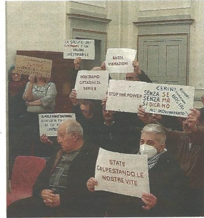
La protesta che i residenti attorno alla centrale hanno messo in scena durante in Consiglio comunale dell'altra sera