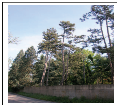
Foto 2 giardino parco