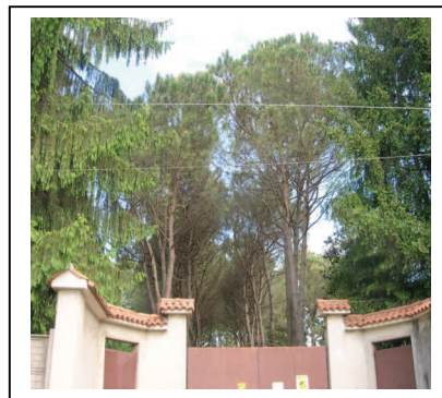
Foto 2 vegetazione ad alto fusto

Vocazionalità Ecosistema filtro Vocazionalità 2 Vocazionalità 3