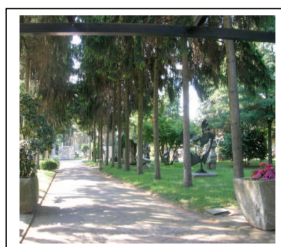
Foto 2 viale principale