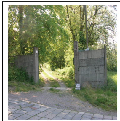
Foto 1 ingresso proprietà

Vocazionalità Ecosistema filtro Vocazionalità 2 Vocazionalità 3