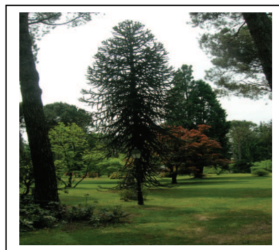
Foto 2 giardino privato

Vocazionalità Ecosistema filtro Vocazionalità 2 Vocazionalità 3