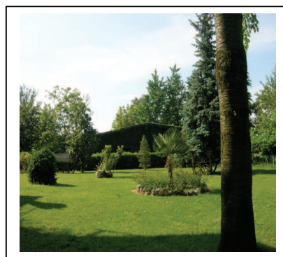
Foto 2 porzione interna del parco