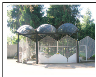
Foto 3 ingresso carrabile