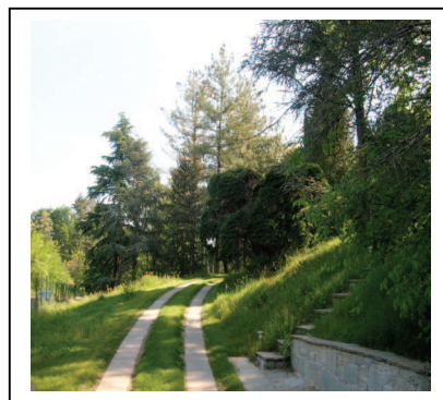
Foto 2 viale interno

Vocazionalità Ecosistema filtro Vocazionalità 2 Vocazionalità 3