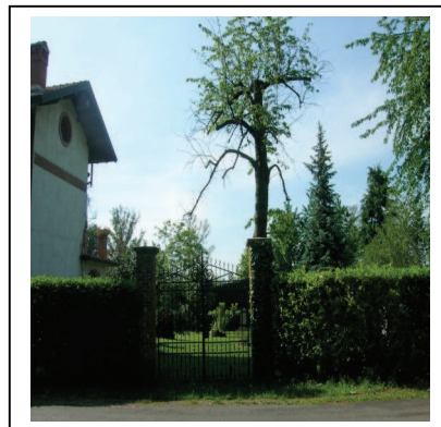
Foto 1 ingresso proprietà

Vocazionalità Ecosistema filtro Vocazionalità 2 Vocazionalità 3