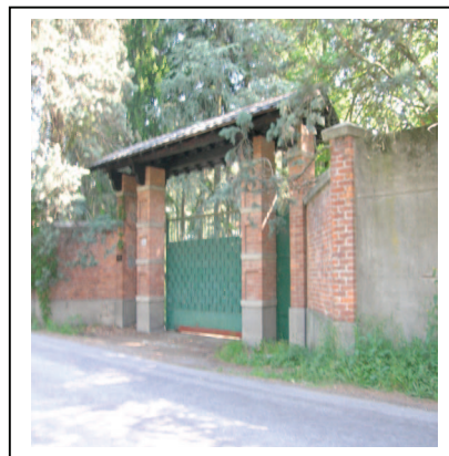
Foto 1 ingresso villa

Vocazionalità Ecosistema filtro Vocazionalità 2 Vocazionalità 3