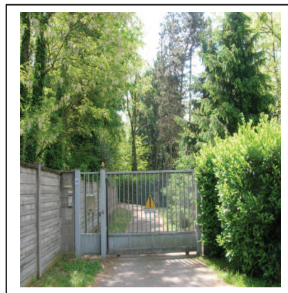
Foto 1 ingresso parco giardino

Località Castellanza Via Nizzolina 60 Ambito Amministrativo