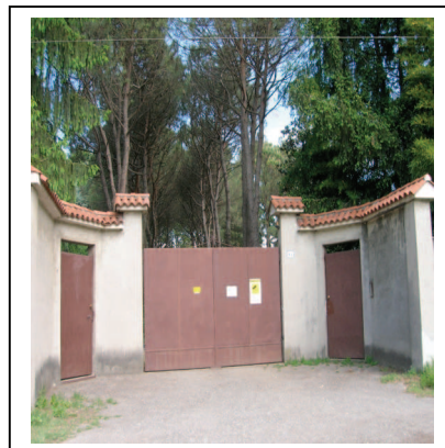
Foto 1 ingresso villa

Località Castellanza Via per Gerenzano Ambito Amministrativo