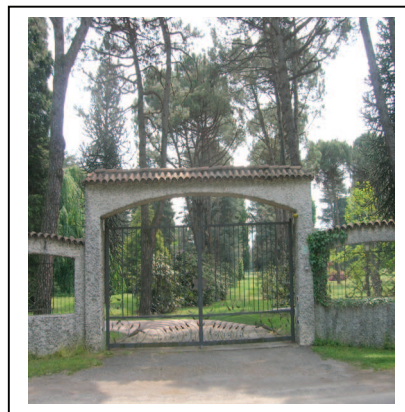
Foto 1 ingresso principale

Località Castellanza Via Per Gerenzano 66 Ambito Amministrativo