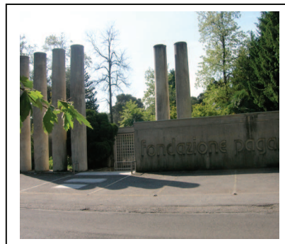
Foto 1 ingresso museo

Tipo di area Parco giardino Fruizione prevalente Privato con servizi di interesse pubblico Destinazione prevalente Culturale Destinazione prevalente 2 Didattico Destinazione prevalente 3 Infrastrutture e dotazioni Tracciati pedonali Infrastrutture e dotazioni 2 Infrastrutture e dotazioni 3 Accessi Regolamentati Area recintata Si Elementi di pregio Buono stato di cura Elementi di pregio 2 Particolari edifici /monumenti / sculture Elementi di degrado Elementi di degrado 2 Vocazionalità Culturale Vocazionalità 2 Ecosistema filtro Vocazionalità 3 Didattico