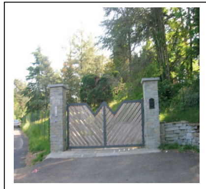
Foto 1 ingresso villa

Località Castellanza Via Per Gerenzano 64 Ambito Amministrativo