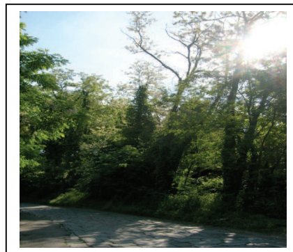
Foto 2 giardino interno